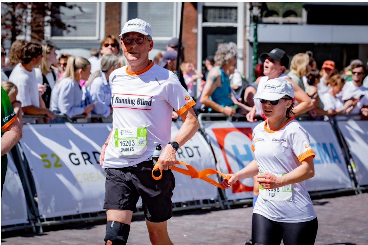
Foto toelichting: Deelname Running Blind aan de marathon van Leiden

Bij het geven van clinics en het deelnemen aan evenementen benadrukt Stichting Running Blind altijd het belang van inclusiviteit, onderlinge samenwerking, goede communicatie en feedback geven en ontvangen. De betrokkenheid van (vaak anonieme) donateurs en sponsors, verenigingen en bedrijven helpt Running Blind om haar doelstelling, namelijk hardlopen toegankelijk maken voor iedereen ook als je een visuele beperking hebt, stap voor stap te bereiken. Wij zien onze sponsors dan ook als partners, ambassadeurs in deze opdracht en danken de bovengenoemde sponsors en alle anonieme donateurs voor hun bijdrage aan SRB in 2025!