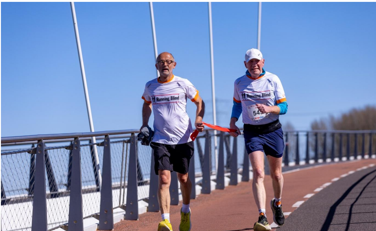
Foto toelichting: Regiogroep Amsterdam neemt jaarlijks deel aan lokale evenementen o.a. de Nescioloop. Daarnaast worden tijdens lokale evenementen clinics gegeven, waaronder bij de Hardloopavond4daagse.