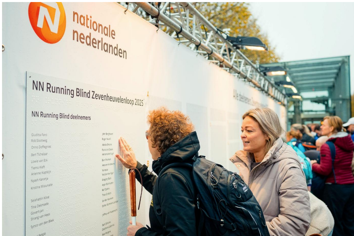
Foto toelichting: Deelnemende Running Blind lopers staan bij wedstrijden van Nationale Nederlanden in braille benoemd.

Verbinden: lopers met een visuele beperking en buddy's binnen Nederland met elkaar te verbinden en ook degenen die wel zouden willen hardlopen maar niet weten hoe te beginnen, verbinden met een buddy of regiogroep.