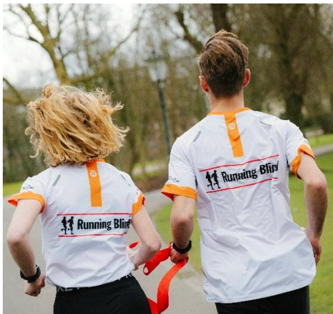
Foto toelichting: herkenbaarheid Running Blind lopers in een shirt gesponsord door Nationale Nederland en een lintje