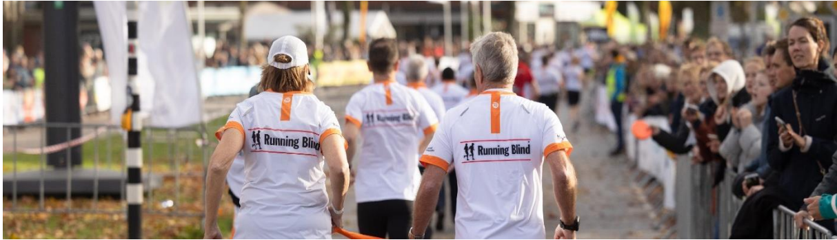
Foto toelichting: herkenbaarheid Running Blind lopers.