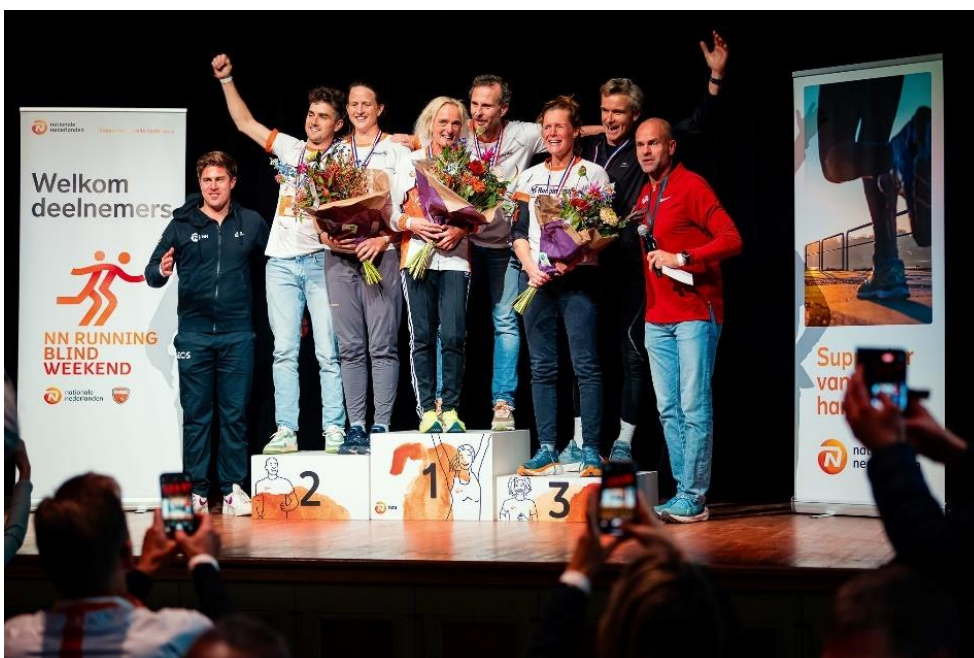
Foto toelichting: Gesponsord hardloopevenement door sponsor Nationale Nederlanden. Op de foto is de prijsuitreiking van het NK Running Blind tijdens het NN Zevenheuvelen weekend in Nijmegen.