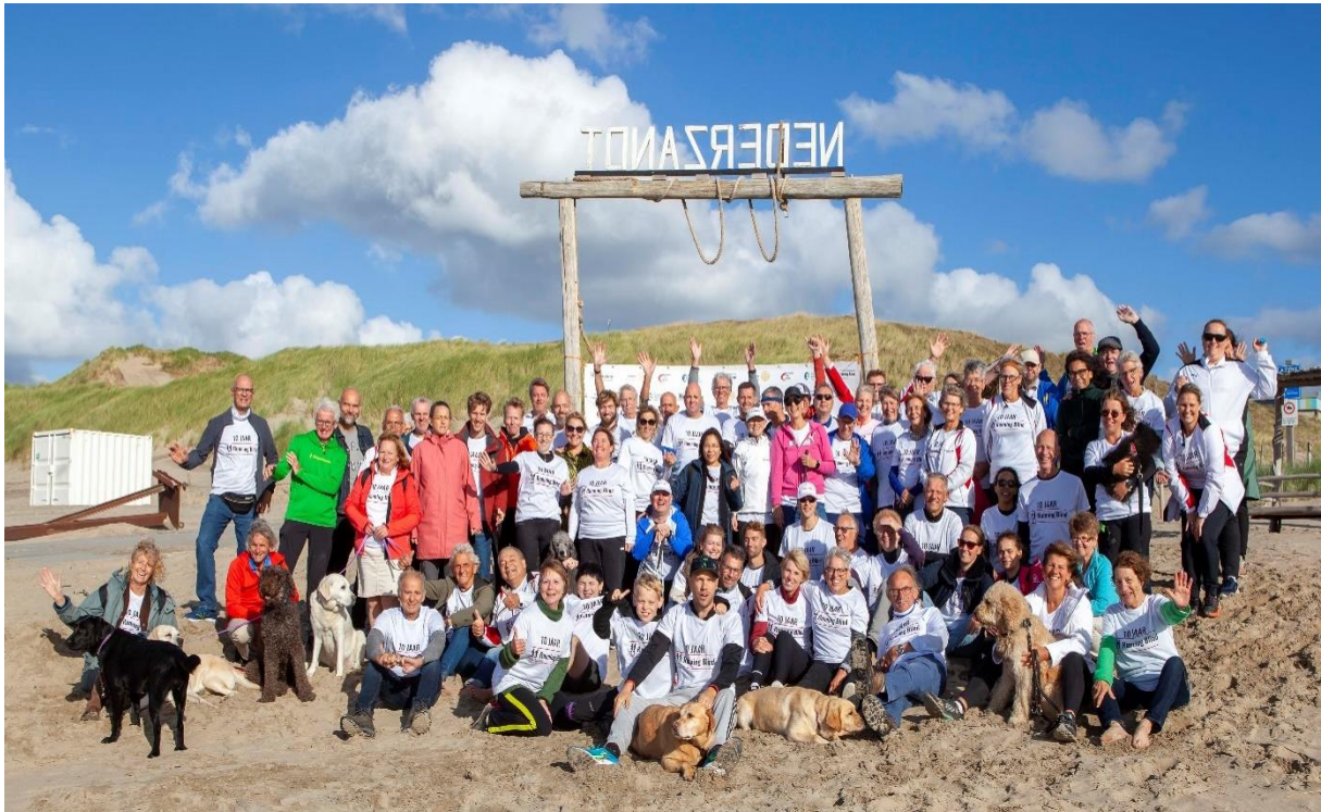
Foto toelichting: 10-jarig jubileumfeest Regiogroep Leiden. Hardlopen verbindt.

Verbinden: lopers met een visuele beperking en buddy's binnen Nederland met elkaar te verbinden en ook degenen die wel zouden willen hardlopen maar niet weten hoe te beginnen, verbinden met een buddy of regiogroep.