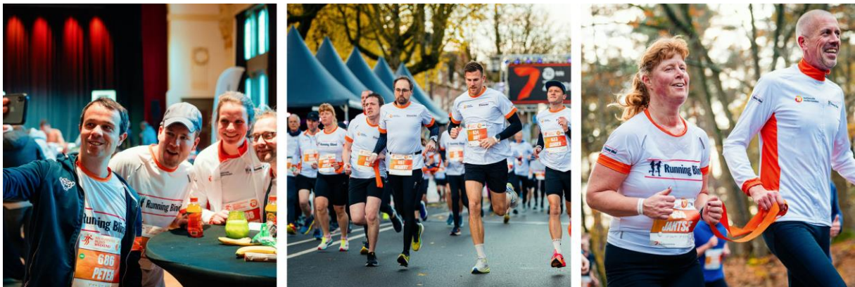
Foto toelichting: sfeerimpressie NK Running Blindweekend 2024.

Tijdens het hele weekend in 2024 deden maar liefst 130 lopers en buddy's mee. Dit was een stijging van 23% ten opzichte van 2023, vooral door een toename van het aantal deelnemers tijdens het NK Running Blind op zondag. Op zaterdag werd wederom de NN Mini Running Blind (800 meter, speciaal voor kinderen) georganiseerd, waaraan enkele fanatieke koppels deelnamen. Tijdens het NK Running Blind op zondag (15 kilometer), waarbij de meest ervaren lopers met een visuele beperking streden om de officiële titel "Nederlands Kampioen", deden 100 lopers en buddy's mee, een stijging van 47% t.o.v. vorig jaar.